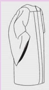
Bachillerato y Asociado